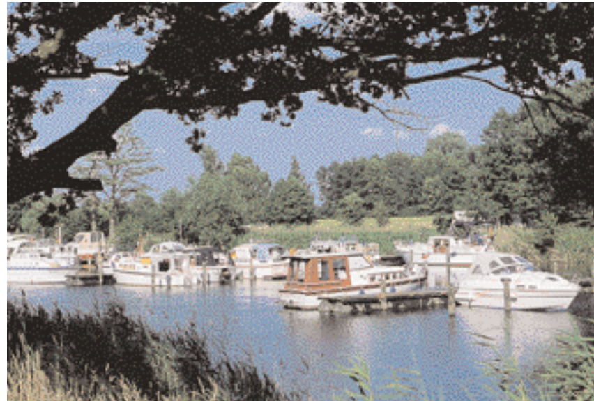
Oben: Wasserwanderzentrum Dömitz