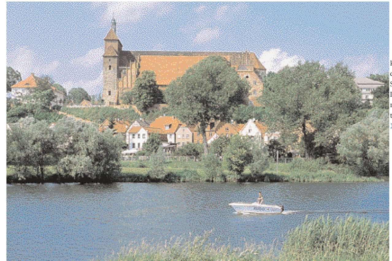
Kirche St. Laurentius.

STILLE SEITENARME UND KLEINE TEICHE BILDEN DAS PANORAMA, SOFERN NICHT IMMER MAL WIEDER REETGEDECKTE DÄCHER ODER SPITZE KIRCHTÜRME ÜBER DIE DEICHKRUNE RAGEN.