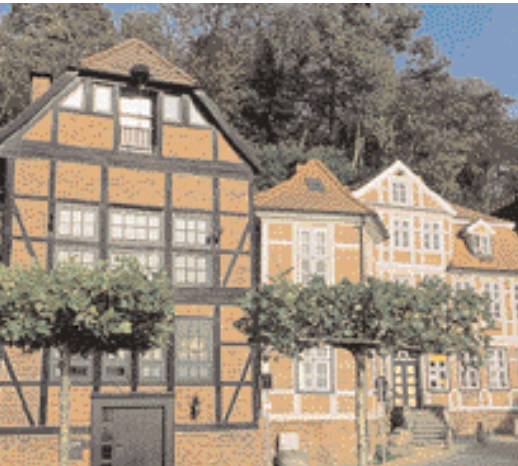
Markante Landmarken: Lauenburg und die Maria-Magdalenen-Kirche (oben und rechts); der Dom zu Havelberg (rechte Seite)